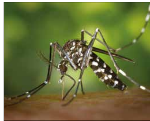
Die Asiatische Tigermücke breitet sich auch im Main-Taunus-Kreis aus.

In den kommenden Sommern könnte sich die Tigermücke stark vermehren. In dem Pilotprojekt wird in Hattersheim-Eddersheim die Mücke verstärkt bekämpft. In Flörsheim und Hochheim sind ähnliche Aktionen geplant. Die Mücke ist in der Lage, Dengue-, Chikungunya-, West-Nil-, Zika- oder Gelbfieber-Viren zu übertragen. Von Mai bis Oktober sollen speziell geschulte Mitarbeiterinnen und Mitarbeiter in der Kommunen in den bekannten Verbreitungsgebieten nach individueller Vereinbarung ausgewählte Grundstücke begehen, um mögliche Brutstätten zu identifizieren. Geschult werden die Mitarbeiterinnen und Mitarbeiter durch das Hessische Landesamt für Gesundheit und Pflege (HLfGP). Sollten die Brutstätten nicht beseitigt werden können, werden sie mit einem biologischen Wirkstoff behandelt. Er ist nach Angaben des HLfGP für andere Tierarten und auch den Menschen ungefährlich.