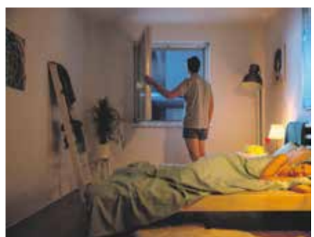
Nach einem heißen Tag ist die Abkühlung am Abend eine echte Wohltat. Mit dem Polltec Schutzgewebe am Fenster ist es das auch für Pollenallergiker – lästigen Pollen bleibt der Eintritt ins Schlafzimmer verwehrt.

Gartengestaltung Celiker GmbH Tel.: 0174 3204279 Mahmutce@hotmail.de