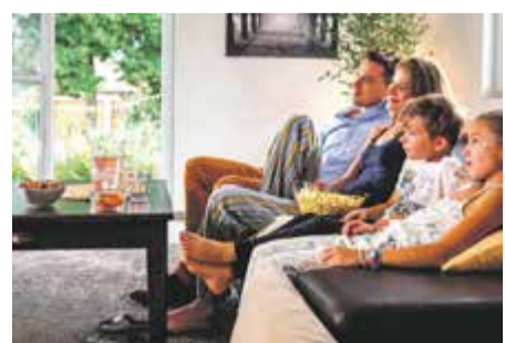
Kein Niesen, keine laufende Nase und keine juckenden Augen: Mit dem innovativen Pollenschutz von Neher können Allergiker in den eigenen vier Wänden entspannt durchatmen und müssen dennoch nicht auf Tageslicht und Frischluft verzichten.

me daher auch nicht unnötig ab. Nicht sicher, welche Lösung es braucht? Kein Problem! Bei Neher erhält man eine persönliche Beratung durch einen kompetenten Fachmann. Mehr unter www.neher.de .