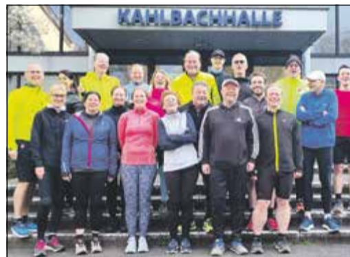
Gemeinsam ist das Laufen schöner: Startpunkt ist die Sporthalle in Altenhain.