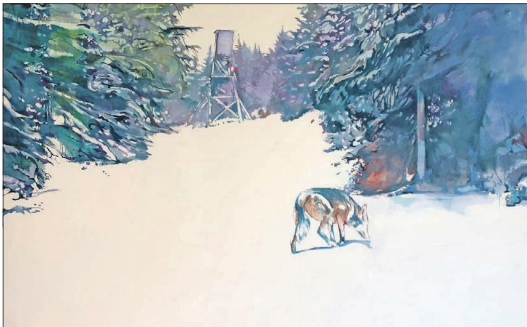
„Tieri(s)ch“ lautet der Titel der diesjährigen Jahresausstellung der Kunstsammlung Landratsamt, die jetzt eröffnet worden ist. Auch Werke von Gisela Krohn sind dabei.