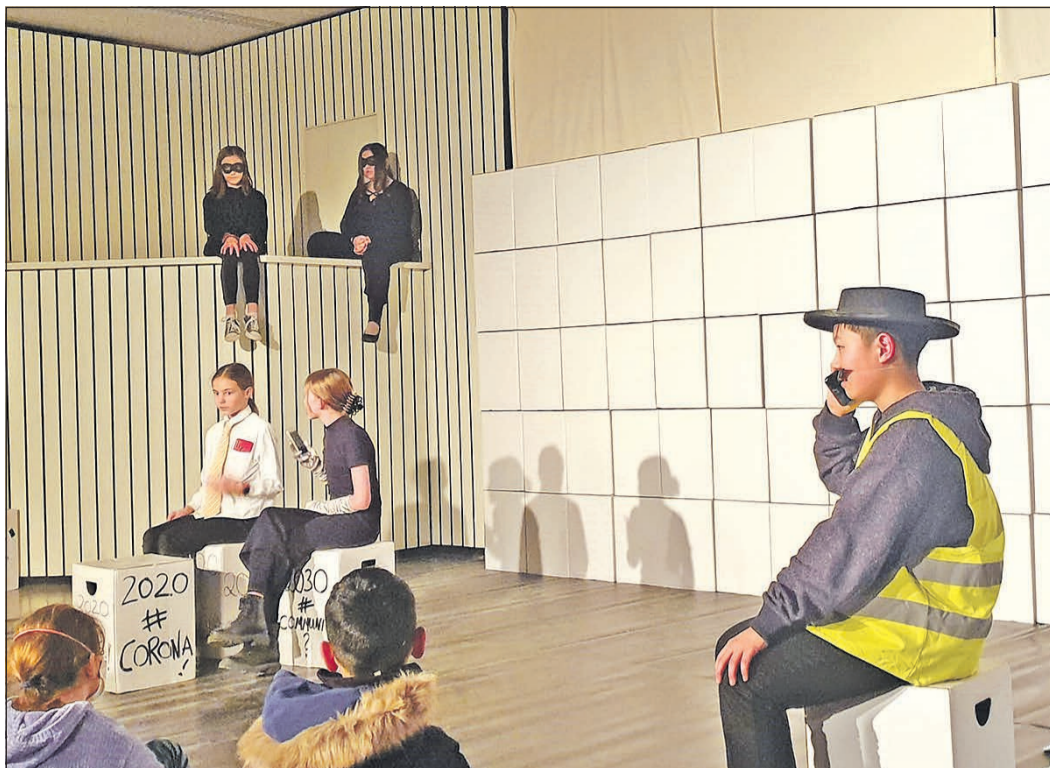
Großes Theater an der HvK: 200 Kinder spielen „Herr der Diebe“.