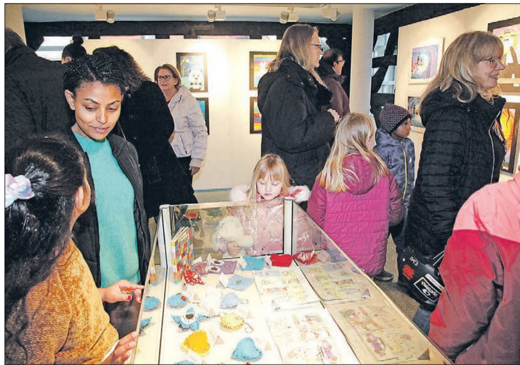
Die jährliche Ausstellung „Kunst aus Kinderhand“ ist noch bis zum 16. April im Stadtmuseum zu sehen.

Für die folgenden Termine ist eine kontinuierliche Teilnahme erwünscht. Die Gruppe ist offen für Menschen mit und ohne Konfession. Infos und Anmeldung: Ruth Coors unter Telefon 06173-7828732 oder Anja Mahne unter Telefon 06196-9314857 oder per E-Mail an anja.mahne@ekhn.de .