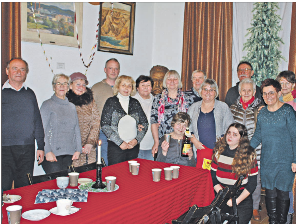
Die Olkuszer Freunde freuen sich über hessischen Apfelwein.