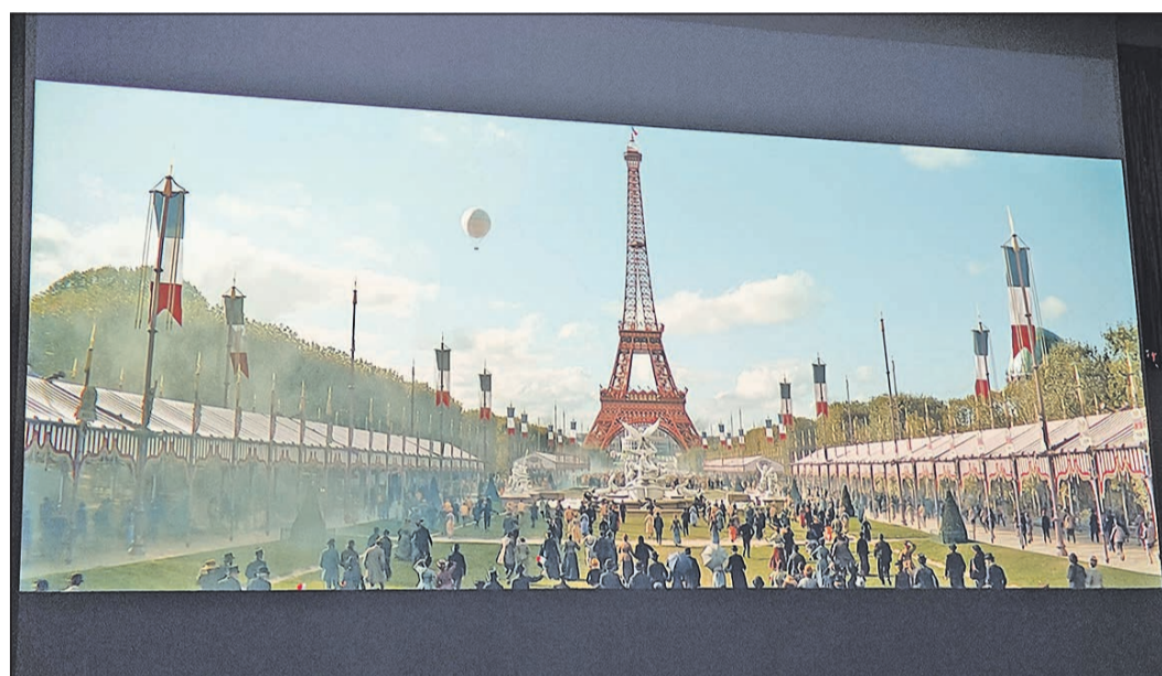
Der Filmabend „Eiffel in love“ kommt beim Publikum gut an.